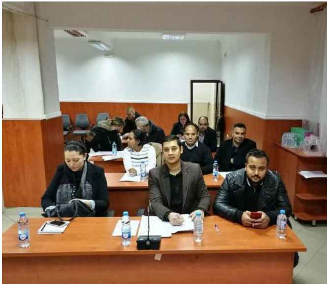
4.2 Седница во општина Шуто Оризари

Тоа би биле модернизиран изглед на пазарот во Шуто Оризари со излози, културни центри, дискотека, библиотека со читална и достапна литература за младите, и побараа место т.е простории каде би можеле да ги одржуваат понатаму своите состаноци и да се договараат за следните предлози. Понатаму сметаат дека има мал напредок во поглед на соработката со општините и дека нивните ставови се од големо значење како идни лица со право на глас, и дека директната соработка со младите е единствен начин локалните власти да ја зајакнат довербата кај младите дека она кое им е потребно ќе се спроведе.